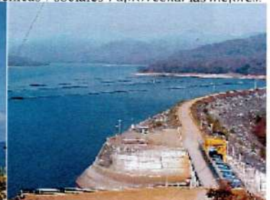
Figura 2a y 2b. Proyecto de la Venta II, en Oaxaca y la presa el Cajón, en los límites de Nayarit y Jalisco, México