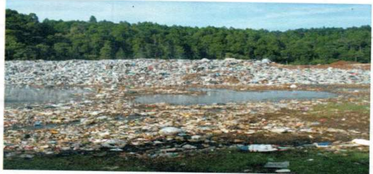
Fig.1 Sitio de disposición final -tiradero a cielo abierto-

Aunque no es posible hablar de una composición promedio, pueden manejarse valores típicos a manera de contar con una referencia. En la tabla 1 se presenta una composición típica de lixiviados de acuerdo con valores propuestos por Bagchi (1990).